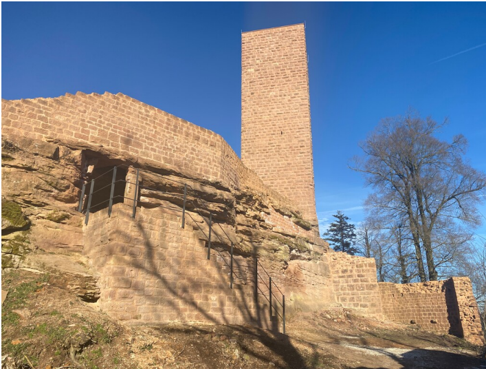
Blick von Süden auf die Scharfenberg (2025)