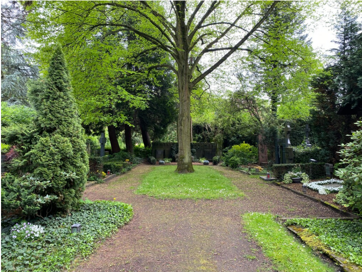
Gräberfeld 1 auf dem Neuen kommunalen Friedhof Frechen (2023)