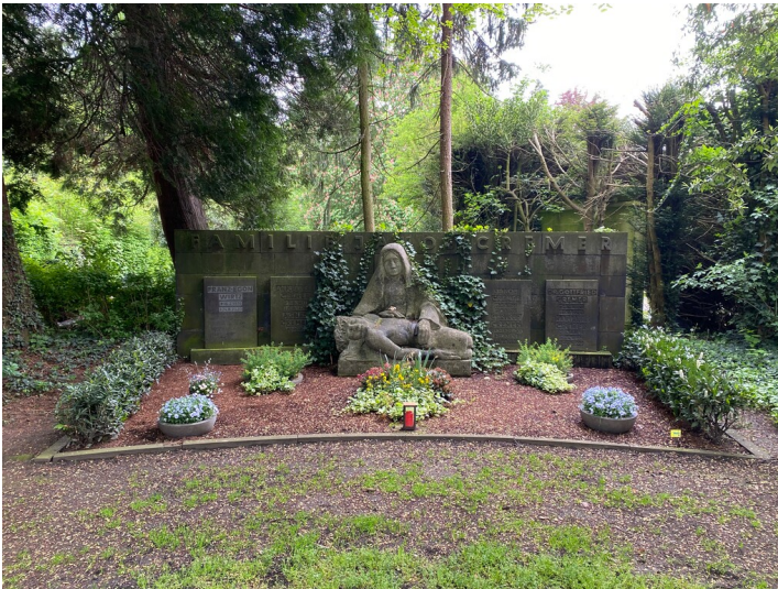
Grabstätte der Familien Jakob und Dr. Gottfried Cremer (2023)