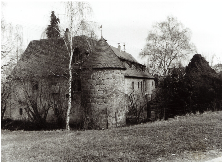
Südwestturm der Burgruine Pleisweiler (1984)