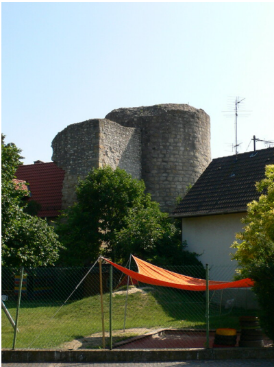
Burgruine Odernheim aus Südwest