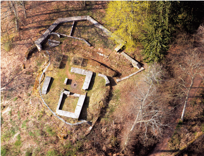
Luftaufnahme der Burgruine Niederauerbach