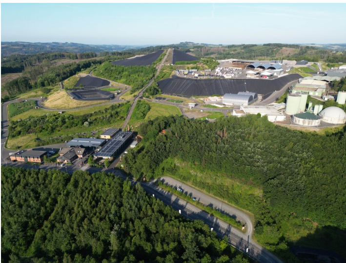
Das Gelände des Forschungs- und Innovationsstandorts :metabolon in der Gemeinde Lindlar (2025).