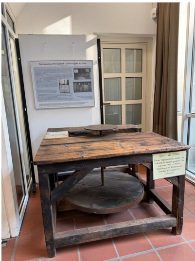
Töpferscheibe aus dem Steinzeugwerk Valentin Roßmann, heute aufgestellt im Stadtarchiv Frechen (2025)