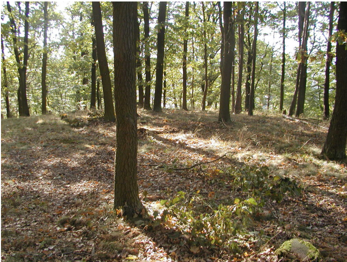
Burgstelle Huneburg bei Kaiserslautern