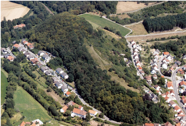
Luftaufnahme von Norden (2004)