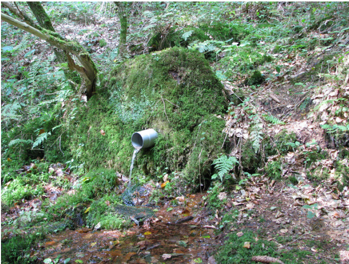
Erntesiegelbrunnen in Esthal