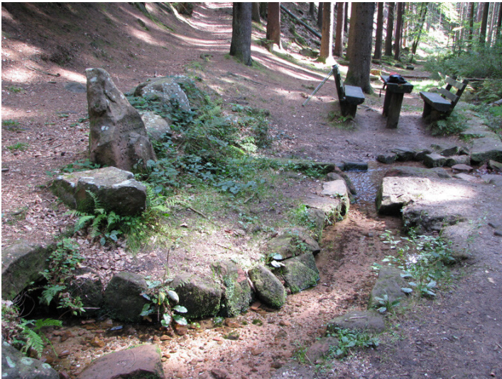
Goldbrunnen in Esthal