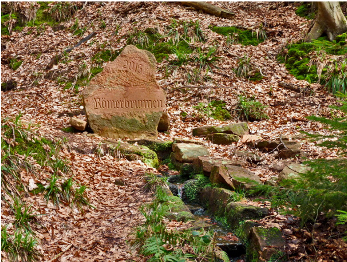
Römerbrunnen in Esthal