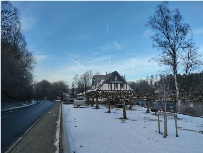
Restaurant "Herrenteich" an der Wahnbachtalstraße (2025)