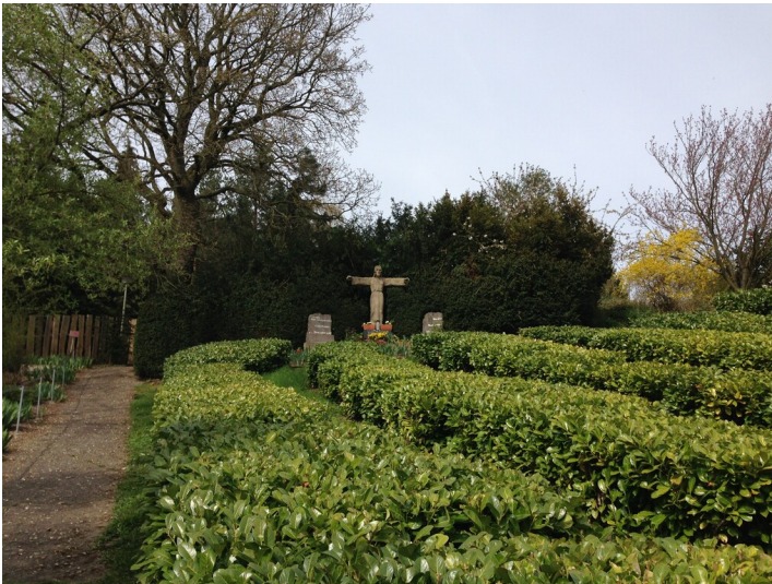
Friedensweg zwischen Alfter und Bornheim-Roisdorf (2015).