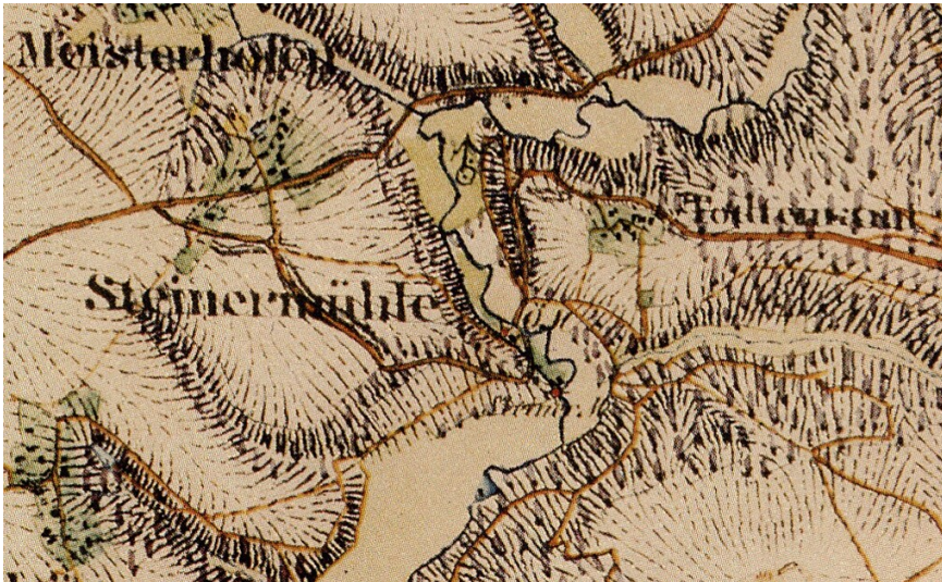
Die Steiner Mühle (M.) und Ölmühle (Ö.M.) sind auf den Karten der Preußischen Uraufnahme (1836-1850) verzeichnet.