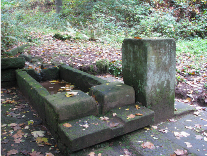
Wögelsbrunnen in Esthal