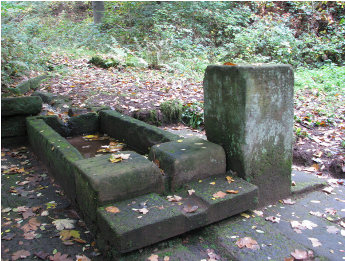
Wögelsbrunnen in Esthal