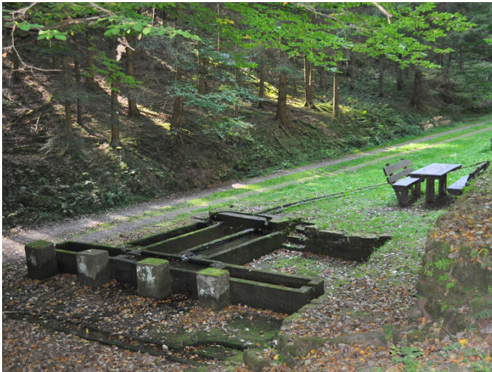
Staufelsbrunnen in Esthal