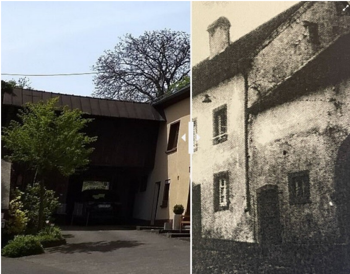
Das Haus Kirchstraße 6 in Oberkail - damals und heute (1920/2024)