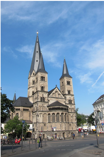
Ostfassade der Katholischen Pfarrkirche Sankt Cassius und Florentius in Bonn (2013)