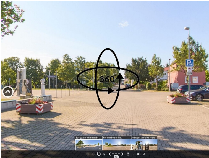
Die Bohligstraße in Mutterstadt - eine 360-Grad-Ansicht (2024)