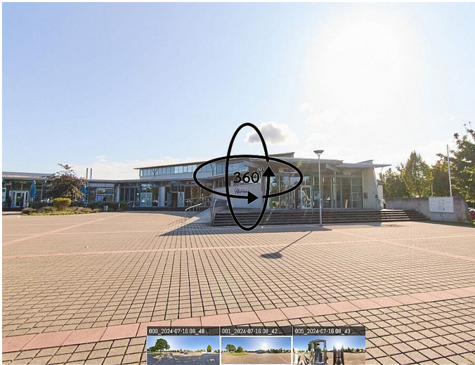
Das Palatinum in Mutterstadt - eine virtuelle 360-Grad-Ansicht (2024)