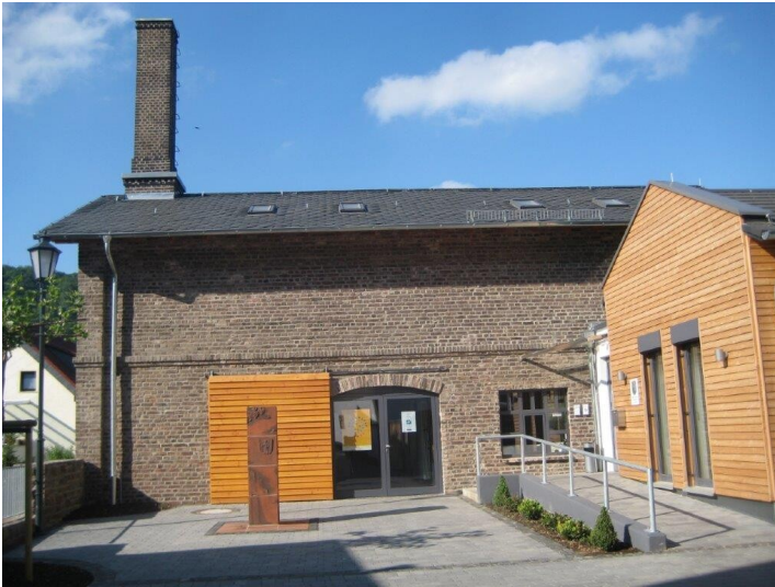
Dorfmuseum in Leutesdorf, Eingangsbereich (2024)