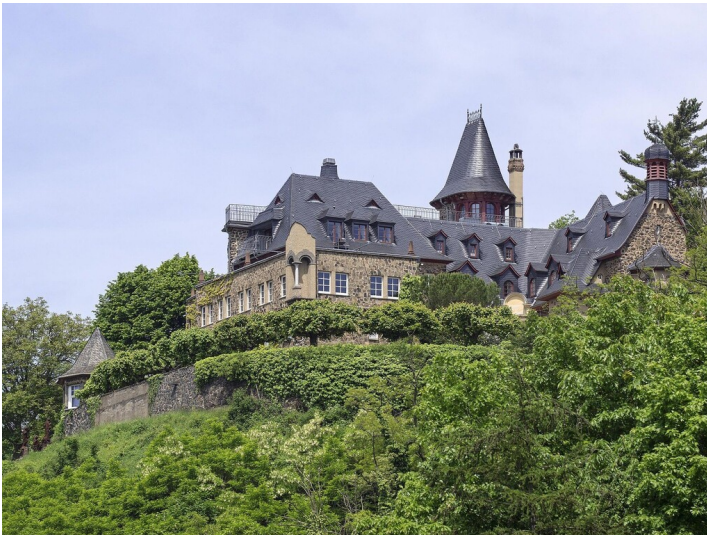
Burg Ockenfels