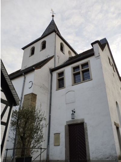
Der Eingangsbereich an der Nordseite der ehemalige Pfarrkirche Alt Sankt Maternus von der Steinstraße aus gesehen. Auf der Wetterfahne ist eine Figur des heiligen Maternus in der Kleidung eines Bischofs mit Mitra angebracht (2024).