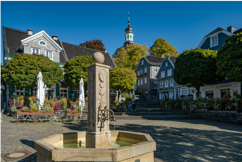
Marktbrunnen in Solingen-Gräfrath (2023)