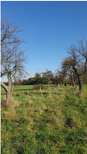
Streuobstwiese am Bitzer Weg