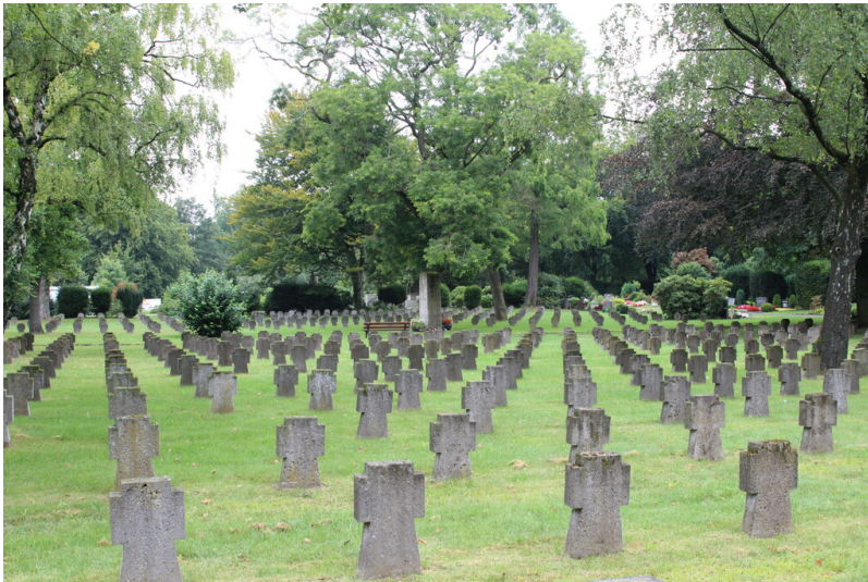
Friedhof Bügelstraße in Duisburg