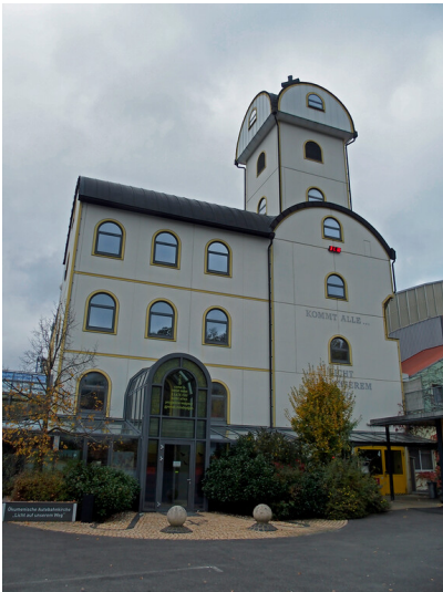
Autobahnkirche Geiselwind (2024)