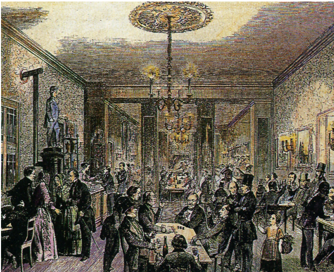
Historischer Stich von (um 1851 aus nicht genannter Quelle): Innenansicht des Café Stollwerck in der Kölner Schildergasse.