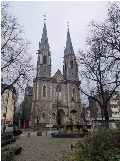
Die Stiftskirche der Pfarrgemeinde Sankt Johann Baptist und Petrus in Bonn aus Blickrichtung des Stiftsplatzes (2024)