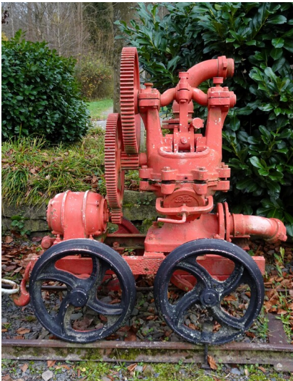
Der Pumpenwagen von der Grube Lüderich auf dem Immekeppeler Dorfplatz (2024)