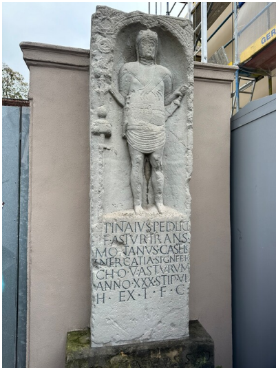
Kopie des römischen Grabsteins des Soldaten Pintaius am Standort des Südtors des römischen Legionslagers (2024).