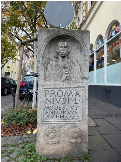
Kopie des Grabstein des Publius Romanus Modestus an der Heerstraße in Bonn (2024).