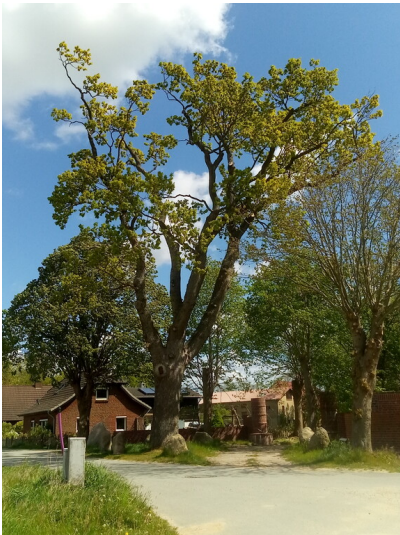
Gedenkeiche und Gedenkstein in Alt-Dörphof (2020)