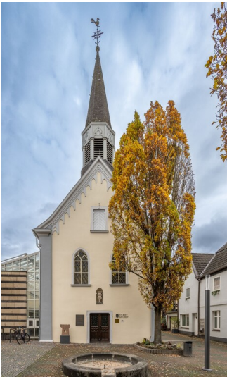
Servitessenkirche in Linz am Rhein (2022)