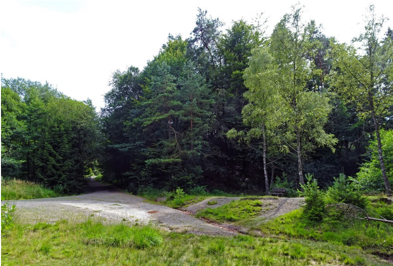
Unterhalb von Haus Hardt befinden sich die ehemaligen Klärteiche der Erzaufbereitung der Grube Blücher (2024).