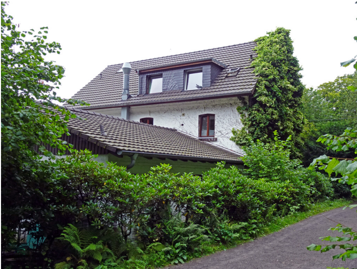
Naturfreundehaus Hardt (2024)