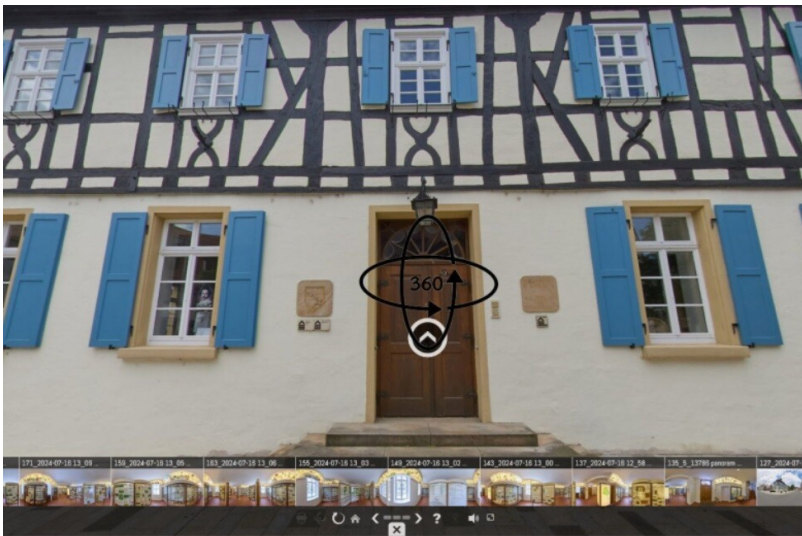
Virtueller 360-Grad-Rundgang durch das historische Rathaus Mutterstadt (2024)