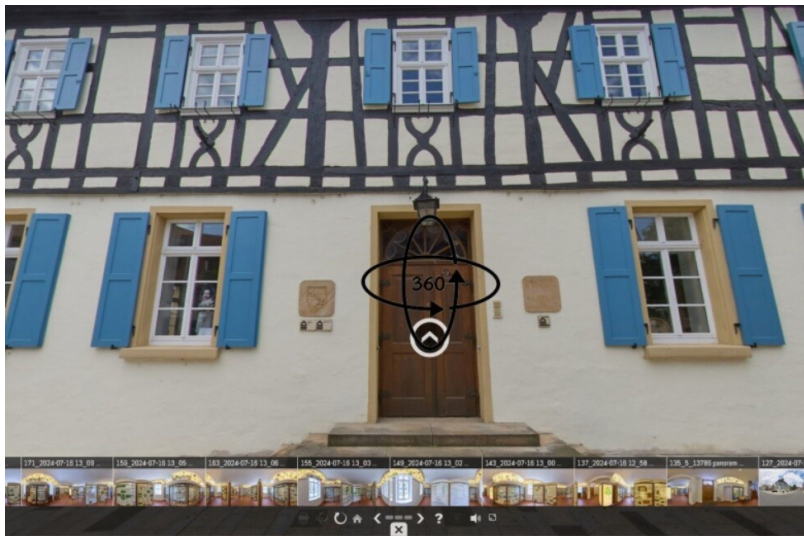
Virtueller 360-Grad-Rundgang durch das historische Rathaus Mutterstadt (2024)