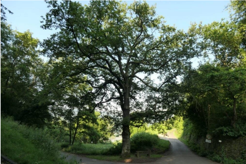
Sommerliche Friedenseiche in Leutesdorf (2024)