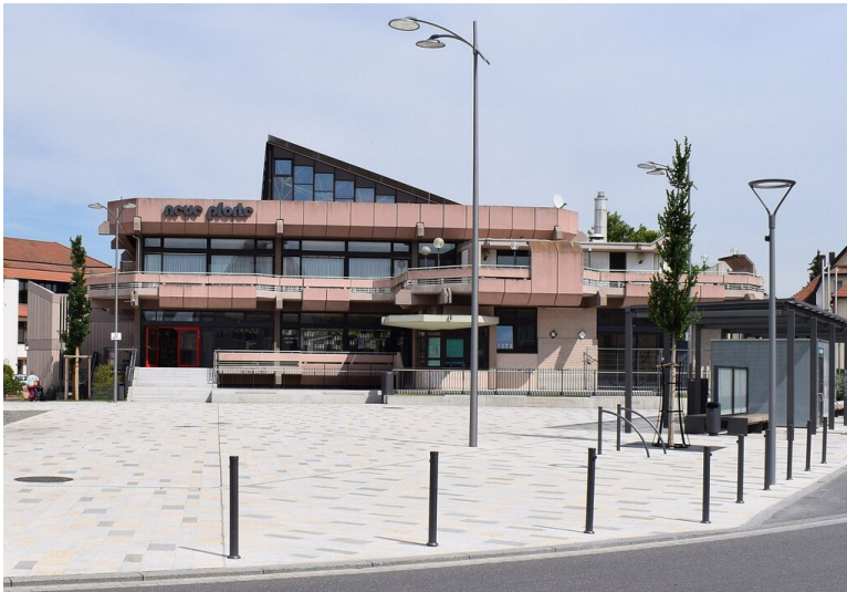
Das Gemeindezentrum Neue Pforte in Mutterstadt (2021)