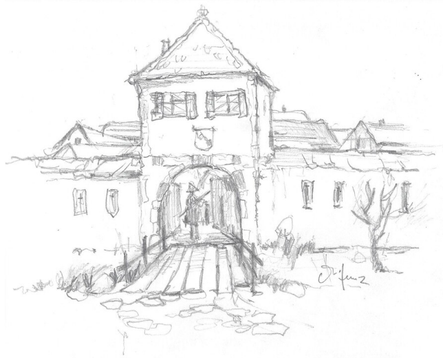
Zeichnung von Michael Kunz mit einem Vorschlag, wie das Untere Tor von Mutterstadt ausgesehen haben könnte Fotograf/Urheber: Michael Kunz