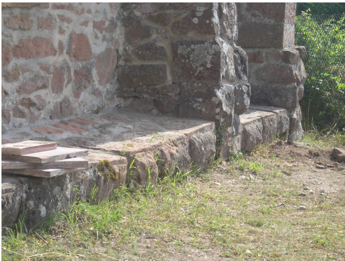
Buckelquader am Sockel der Südwand (2004)