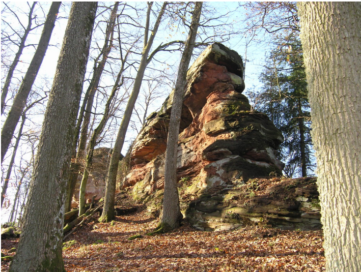
Ansicht von Nordosten (2005)