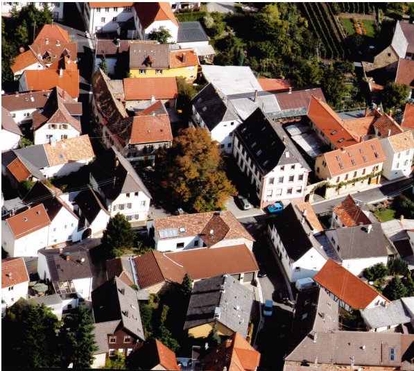
Luftaufnahme von Südwesten (2004)