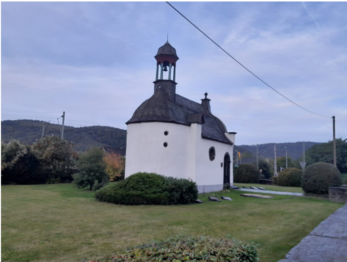
Ölbergkapelle in Leutesdorf (2024)