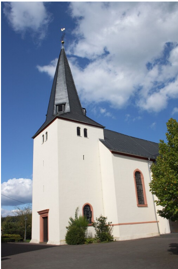
Die Kirche Sankt Michael in Oberkail (2024)