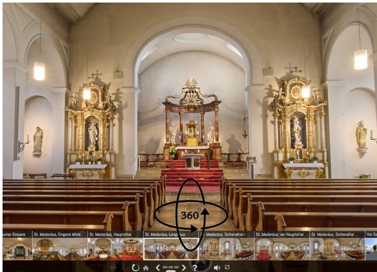
Die katholische Kirche Sankt Medardus in Mutterstadt - eine virtuelle 360-Grad-Tour (2024)