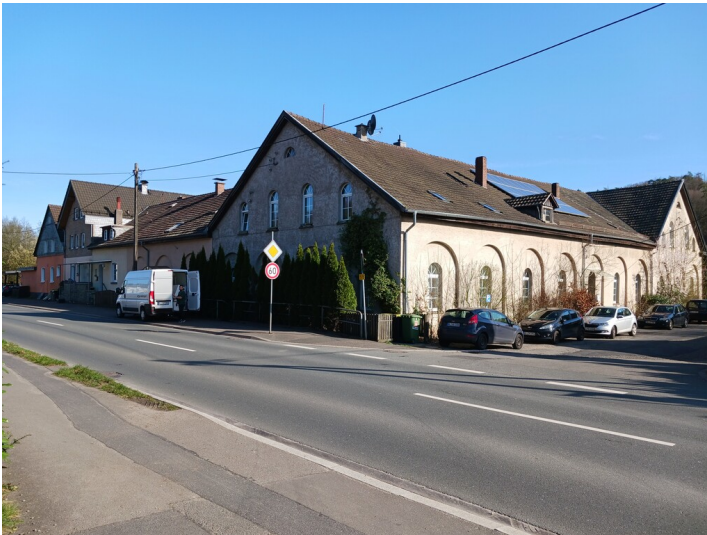
Blick von Nordwesten (Straßenseite) auf den Westflügel und den nur teilweise erhaltenen Nordflügel des Betriebsgebäudes der sogenannten Immekeppeler Hütte, errichtet um 1850. Der Westflügel zeichnet sich durch flache, bogenförmige Wandfelder aus, die kleine Fenster umfassen (2024).